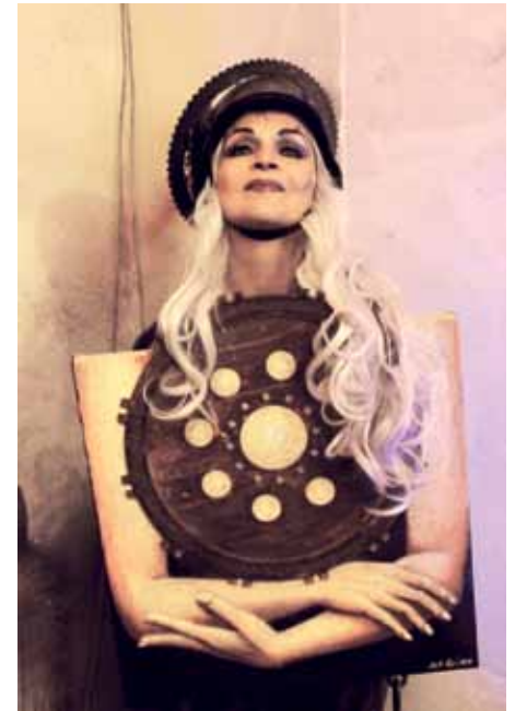
Ulrike Grimm mit Ihrem Werk "Patience", Foto: Gerd Weckesser, 2017 bei der Lichtmeile Mannheim